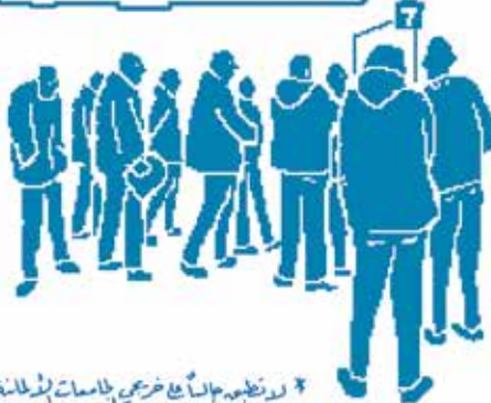
* لوظيفة مالي في فرع في جامعات ألمانية

لأني لست مواطناً من الاتحاد الأوروبي، لم يسمح لمديري بتوظيفي في حال وجود مقدم ألماني أو أجنبي لنفس الوظيفة بنفس المؤهلات، فالضرورة لهم! لذلك قال مديري يريد التوجه إلى ألمانيا*.